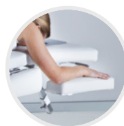
SUPPORTS DE BRAS